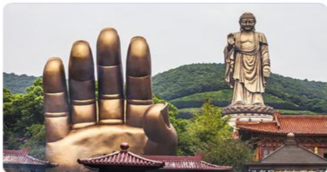
《佛教哲学》— 灵山大佛