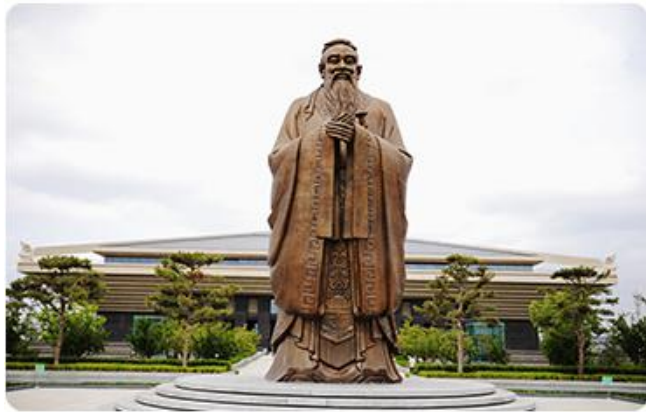
《孔孟之道论先哲智慧》— 曲阜